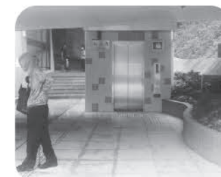
九龍醫院的新升降機於2017年1月落成 (位於亞皆老街出入口、可通往醫院西翼 及主座大樓)