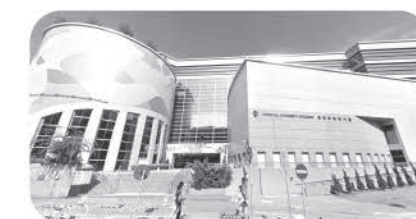
醫管局大樓經爭取後建成無障礙斜道