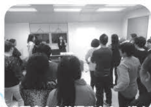
「自閉症人士的運動人生」講座

基於自閉症的獨特與複雜性，服務上仍存在很多的空隙需待填補及完善，特別是智障成人服務。一直以來，家長們不斷反映於學前及學齡設有的自閉症資源服務應銜接至成人階段，惟未獲當局接納。其實踏入此階段的自閉症人士，內外均呈現急切的轉變。體型上他們大多變得健碩魁梧，孔武有力。情緒上起伏不定，容易激動，自傷及暴力行為，屢見不鮮，更甚者不少在精神方面還出現問題。部分自閉症人士同時有睡眠困難，引伸於現時宿舍夜間的人手編制，是否可以同時應付接踵而來的突發事件？情況令人憂慮，值得當局正視關注並考慮為成人服務中的自閉症人士增撥資源。