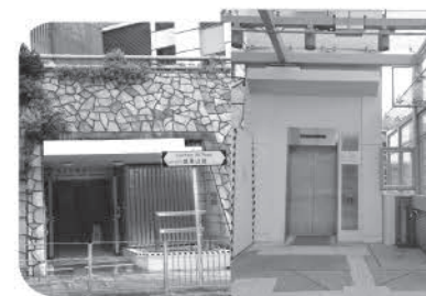
瑪嘉烈醫院的新升降機於2017年2月落成 (連接荔景山路往瑪嘉烈醫院急症室樓層)