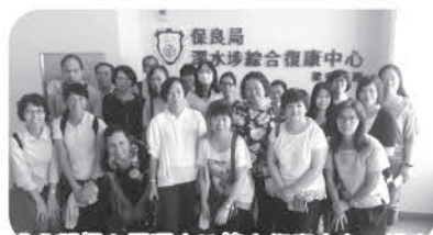
「參觀保良局深水埗綜合復康中心」講座